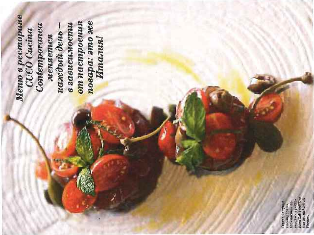
Творец на улице Сполондраном, Базилликом, ко- пеевским и посты- роме Caffè dell'Orto Pomodoro Portofino Firenze.

Меню в ресторане CUCO Cucina Contemporanea меняется каждый день — в зависимости от настроения повара: это же Италия!