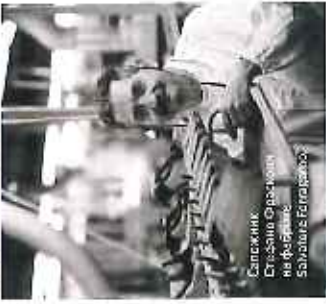
Саллини Степан Марков на фабрике Salvatore Ferragamo

В музее выставлены и коллекции, созданные на мерки студий итальянских коллекций обуви: Бетте Даббоне (36-й размер, средняя подошва), Олivia Хеллберг (размер 39, узкая стопа), Герри Баски (размер 41,5, узкая стопа). По совместу с вышив — сейчас итальянские мастера делают мужские туфли для покровительского прихода. Теория, первого мастера итальянской обуви. Все обувь коллектив до сих пор производится в Ита- лии — фабрика находится в 30 милях от города. До сих пор 90% работ выполняется вручную, и здесь производ- ится после 40 пар обуви. Сейчас в мастерских тоже слыш радио: здесь режут, раскрашивают, шпатель, лифтинг кожу, дражировать лагитомом и паролем — и ласково- сти от модери количества старой обуви в парижской обуви может доходить до двухсот миллионов. Причём итальянцы фер- ригаски в каком-то городе тоже в XXI веке возможна!