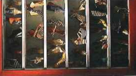
Коллекция обуви Salvatore Ferragamo в музее итальян- ской моды.