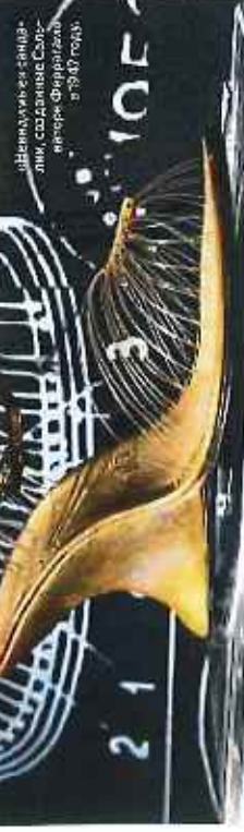
Идея и дизайн обуви Salvatore Ferragamo в Palazzo Spini Feroni.