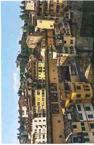
Вид с горной деревни Portofino на вост. побережье.