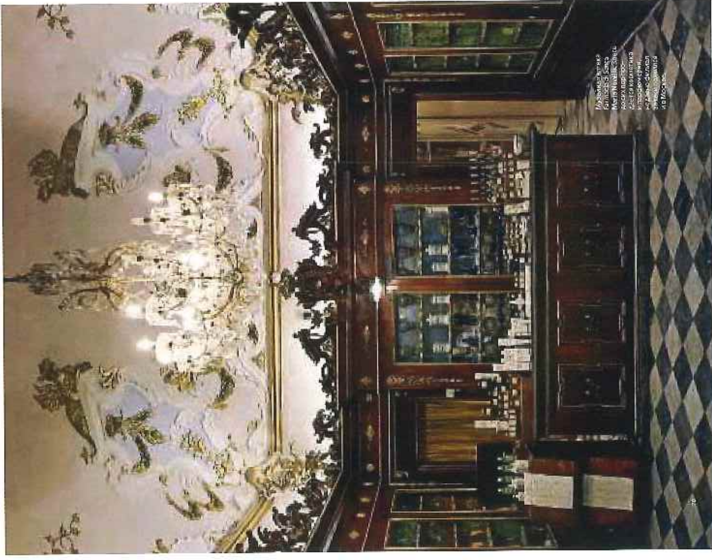
Музей моды Флоренция, Италия Автор проекта Саймон Каллендер