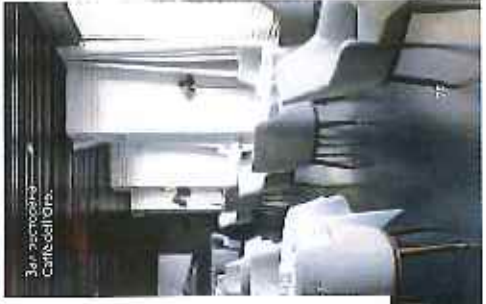
Зал кафе Caffè dell'Orto.