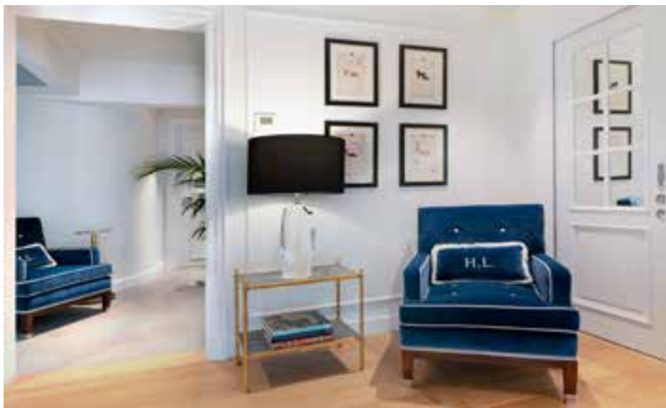
Sala Guarnieri HOTEL LUNGARNO