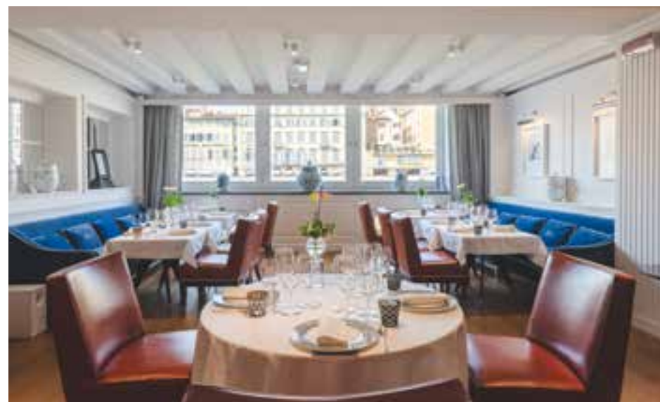
Ristorante Borgo San Jacopo HOTEL LUNGARNO